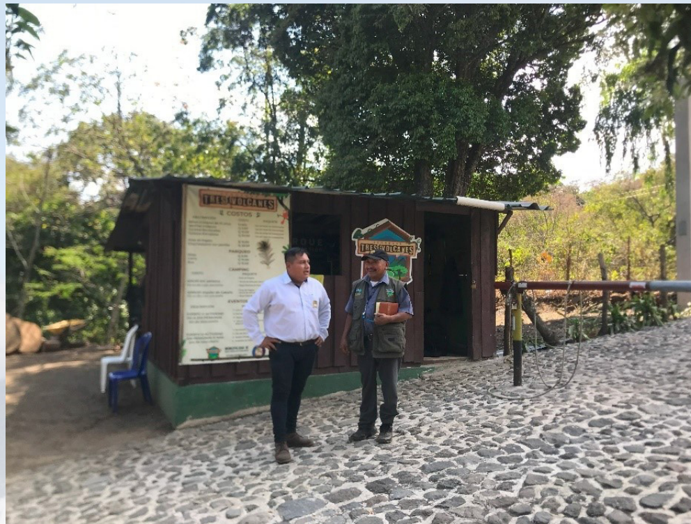
Entrada el centro ecoturístico Tres Volcanes

Con el plan maestro se espera beneficiar a la población urbana del municipio y a comunidades cercanas por medio de los servicios ecosistémicos como acceso a leña, broza, producción de oxígeno, semillas de especies forestales y ecoturismo; actualmente la municipalidad ha realizado mejoras en la infraestructura del centro, para los visitantes y se cuenta con un plan de manejo forestal para incentivos del proyecto PROBOSQUE (57.69 hectáreas equivalente al 20.2% del área total) que están siendo gestionados ante INAB, lo cual beneficiará a la sostenibilidad del manejo.