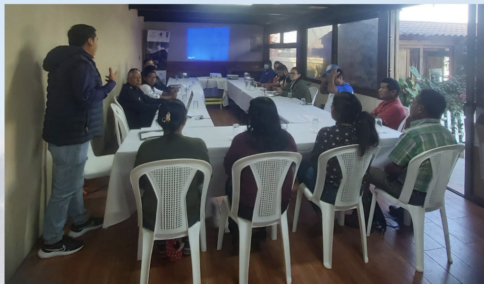
Taller con actores locales del municipio de San Juan Alotenango

Como parte del proceso de elaboración del plan maestro se han tenido intercambios con la comisión de turismo, ambiente y recursos naturales del concejo municipal para presentar el proceso y la Unidad de Gestión Ambiental Municipal, UGAM al cual se le ha encomendado ser parte del equipo planificador. En el proceso se han realizado visitas de campo al área del PRM y un taller de consulta con actores locales e instituciones rectoras como CONAP en el cual se validó el diagnóstico, principales amenazas y se aportaron insumos para elaborar los elementos de consideraciones, como análisis de las categorías de manejo y los criterios para la zonificación.