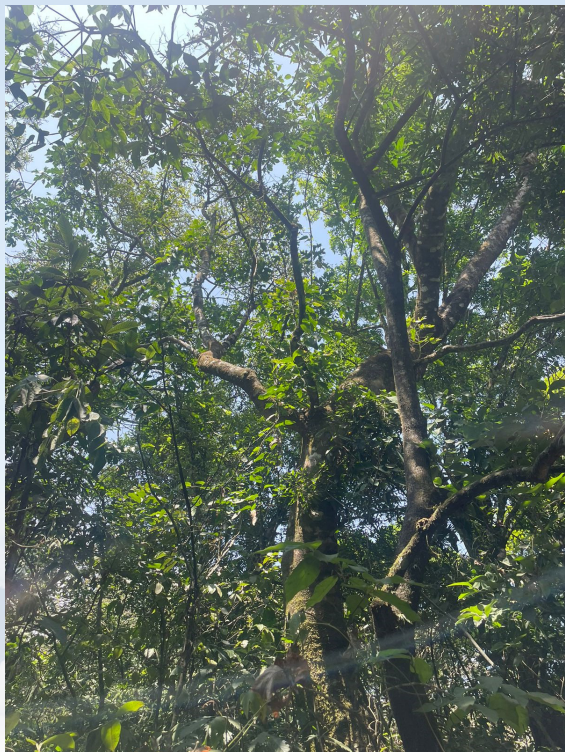
Bosque latifoliado de la parte alta zona manejo sostenible del PRM