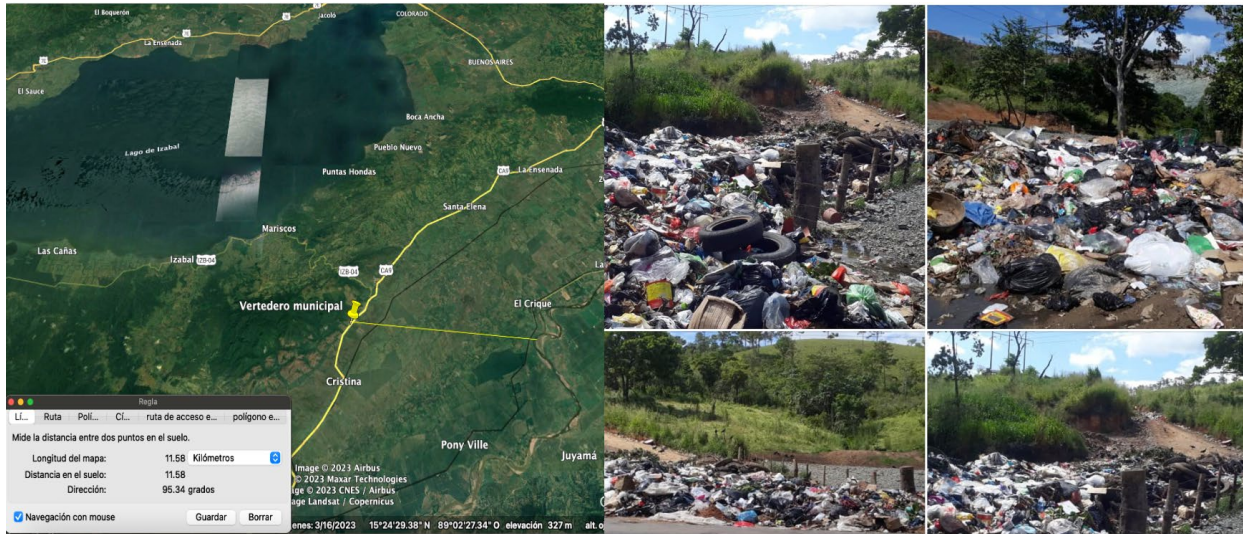
Ubicación del vertedero municipal, respecto al río Motagua y situación de las basuras recolectadas.