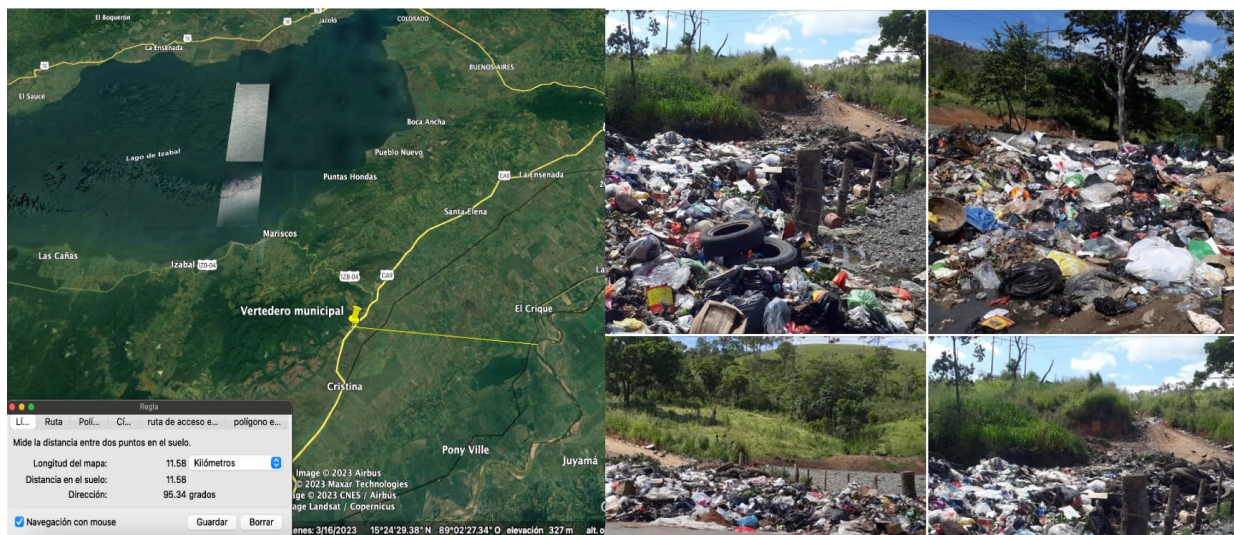
Ubicación del vertedero municipal, respecto al río Motagua y situación de las basuras recolectadas.

Vertedero municipal: El vertedero municipal a cielo abierto de los Amates, está localizado en el kilómetro 215 de la carretera CA-9 Norte, no existe un manejo apropiado de los vertidos, la municipalidad contrata maquinaria en forma esporádica para algunos reacomodos de las basuras. El sitio se localiza a más de 8 km de la orilla del lago de Izabal y más de 11 km del río motagua, a 15 km de de la cabecera. Este terreno no es propiedad municipal.